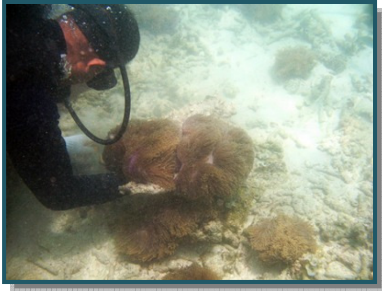
ขนย้ายดอกไม้ทะเลขึ้นบนเรือท่องเที่ยว